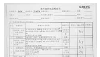
Informe de control de calidad