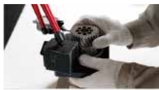
Prueba de motor / reductor