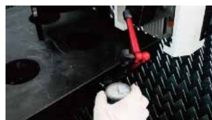
Regla cuadrada de mármol