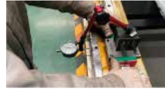
Detección de piñón