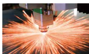
Prueba de corte de la máquina