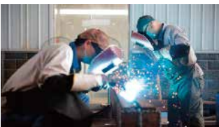
Soldadura de base de la máquina