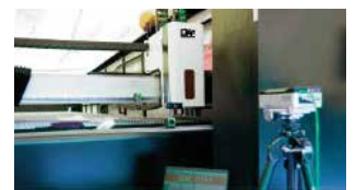
Prueba con interferómetro láser