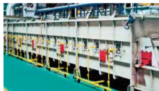
Tratamiento térmico de la base de la máquina