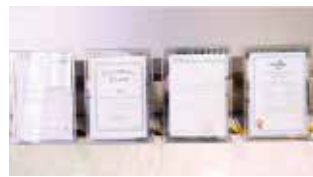
Certificación de calificación de piezas de la máquina y de comercio