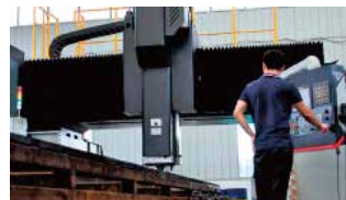
Control de calidad de piezas mecanizadas