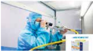
Prueba de fuente láser