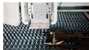
Prueba de barra de doble bola