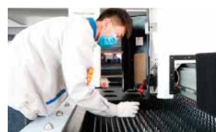
Prueba de calidad corte