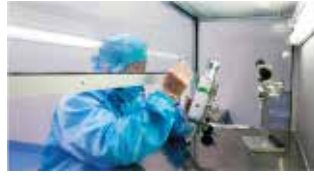
Prueba de cabezal láser