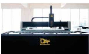
Prueba de funcionamiento de la máquina