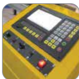
Panel de control Pantalla 7"