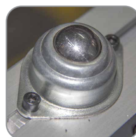
Deslizadores de plancha