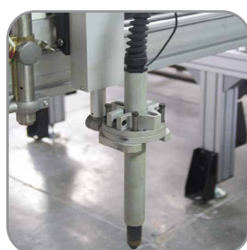
Antorcha Plasma Con control de altura