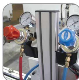
Entrada de gases Oxígeno/Acetileno.